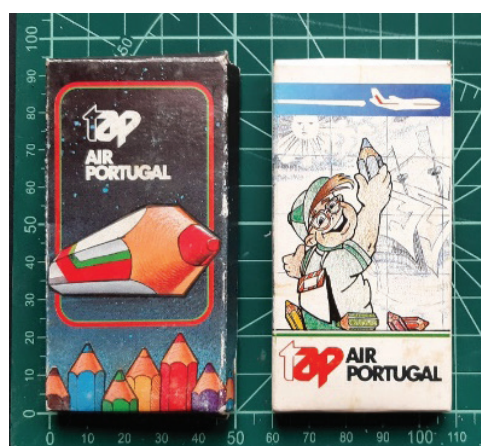
Fig. 3 Duas caixas de lápis TAP (década de 80). Colecção do autor.