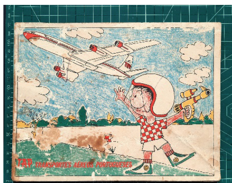
Fig. 4 Diário de voo TAP (s/d). Colecção do autor.