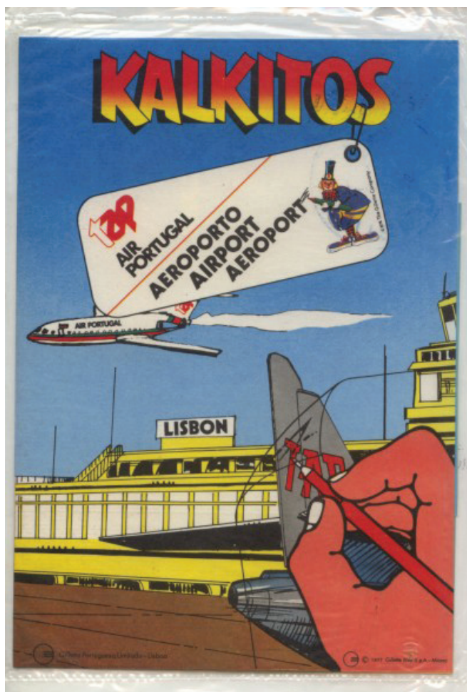
Fig. 11 Kalkitos customizado para a TAP (década de oitenta). Museu TAP.

Selecione um objecto pela sua originalidade e destaque que alcançou durante a sua vida como giveaway. Ninguém que pertença à geração baby boomer terá esquecido os Kalkitos. Tratava-se de cartolinas com paisagens ou recriações de diversos ambientes que podiam ser personalizados através de figuras decalcadas. Muitos os terão coleccionado e ainda os possuirão algures guardados nos seus baús de recordações. Alguns, ou a maioria, desconhecem que a TAP também produziu e personalizou um destes Kalkitos, nunca comercializado, o qual apresenta o ambiente da placa do aeroporto de Lisboa com aviões da TAP Air Portugal (logo de 1979) (Fig. 11).