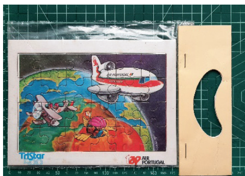
Fig. 8 Puzzle em cartolina alusivo ao Boeing 747 da (década de setenta). Museu TAP.