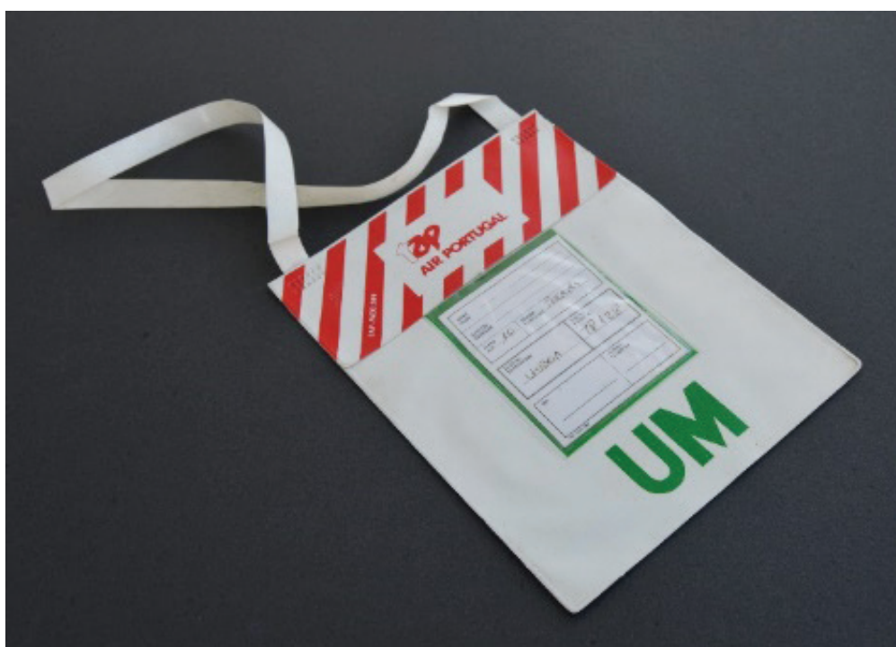
Fig. 1 Modelo Bolsa TAP em vinil para identificação de menores não acompanhados (década de 80).

O modo para captar a atenção das crianças e mantê-las concentradas e ocupadas centrou-se à época na distribuição de passatempos e jogos didácticos. Os livros e lápis de cor foram quase obrigatórios ao longo de várias décadas (Figs. 2 e 3). Apesar da qualidade muito duvidosa da grafite, o logótipo da companhia de aviação neles gravado, foi usado e exibido orgulhosamente junto dos colegas de escola ou grupo de amigos, como objecto de status (Baudrillard, 1995), confirmando o seu “baptismo do ar”. Embora em processo de redução de tarifas, devido ao aumento da lotação dos aviões a jacto, a viagem aérea, sobretudo em Portugal, ainda tinha preços elevados para a classe média. Portanto, ainda poucos o faziam. Confirmando esse status foram igualmente distribuídos “diários de bordo” ou “diários de voo”, nos quais se podia registar a data, a rota e o tipo de avião, autenticados com a assinatura do comandante (Fig. 4).