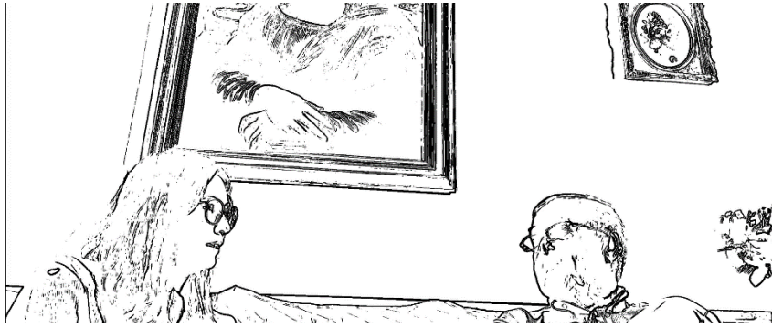
Figura 4 Fotograma 3 da Entrevista 5 - [00:07:10]