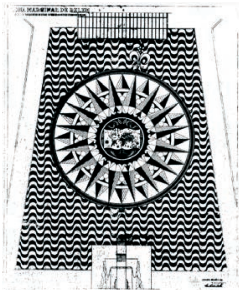
Figura 5 – Desenho do atelier de Luís Cristino da Silva. Desenho de conjunto Padrão dos descobrimentos e Rosa-dos-Ventos. 6