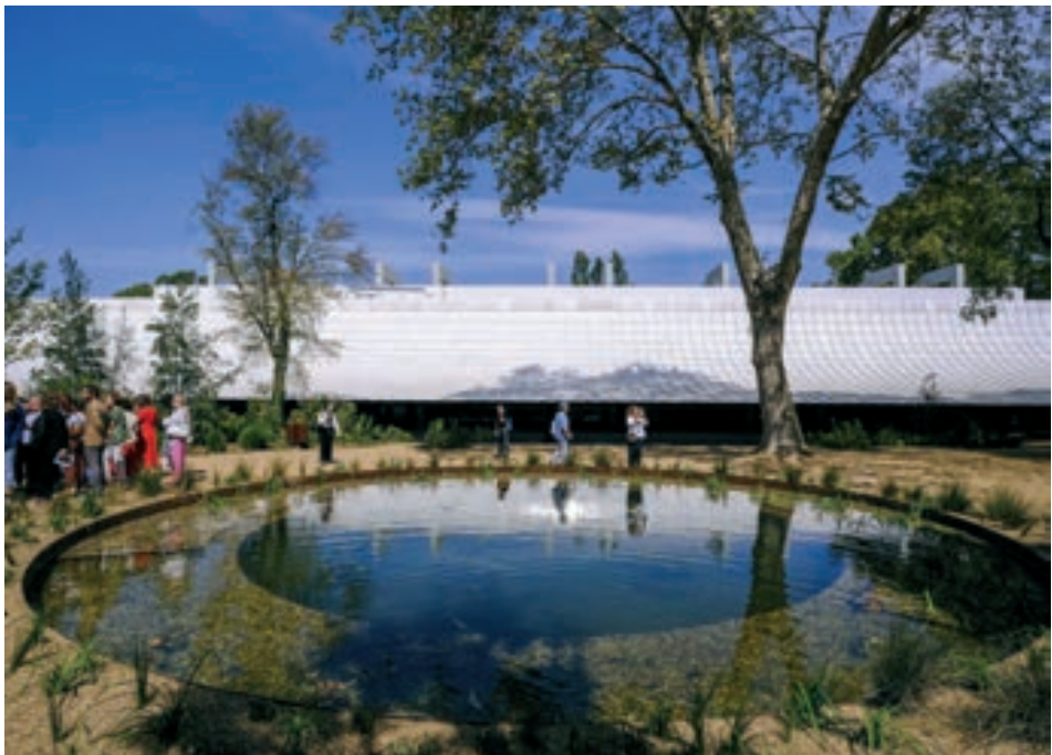
Figura 1 - Centro de Arte Moderna 1

Na arquitetura Venustas refere-se ao apelo visual, à estética, o que pode ser traduzido por beleza, pelo impacto que o edifício ou a construção tem nas pessoas e/ou utilizadores o acréscimo cultural ou mesmo acréscimo na valorização do edificado e da sua envolvente. A inclusão no património local assim como a experiência vivenciada pelas pessoas pode ser traduzida em impacto de beleza, harmonia, criatividade e inovação (M. Mehaffy & Salingaros, 2021).