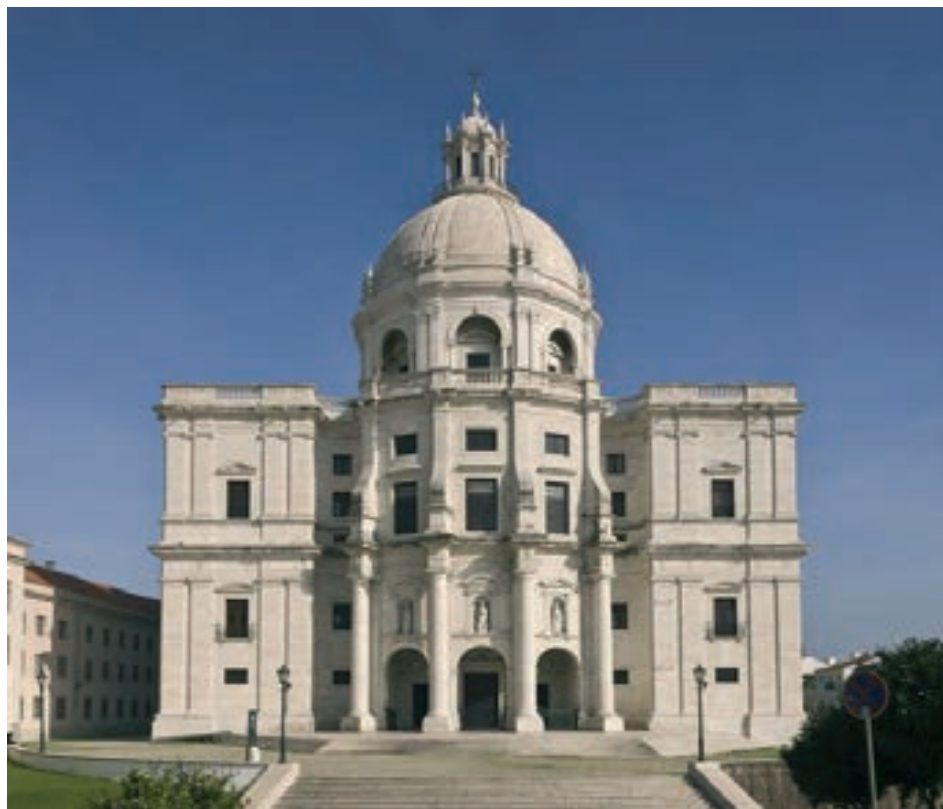
Figura 3 – Fachada do Panteão Nacional, também conhecido como a Igreja de Santa Engrácia do Arqº

A simetria vertical é bastante comum na arquitetura e, sempre, associada ao corpo humano. Mas o conceito é muito mais amplo, além da simetria reflexiva na geometria, há simetria rotacional, simetria translacional, simetria de escala e muitas composições (Lockwood, 1978).