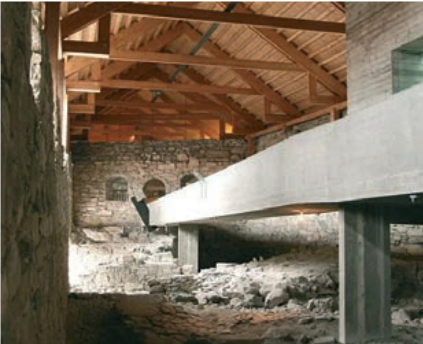
Fig. 5 - Anno Museum, Hamar, Noruega - fotográfico Frederik Garshol, visitnorway.com.