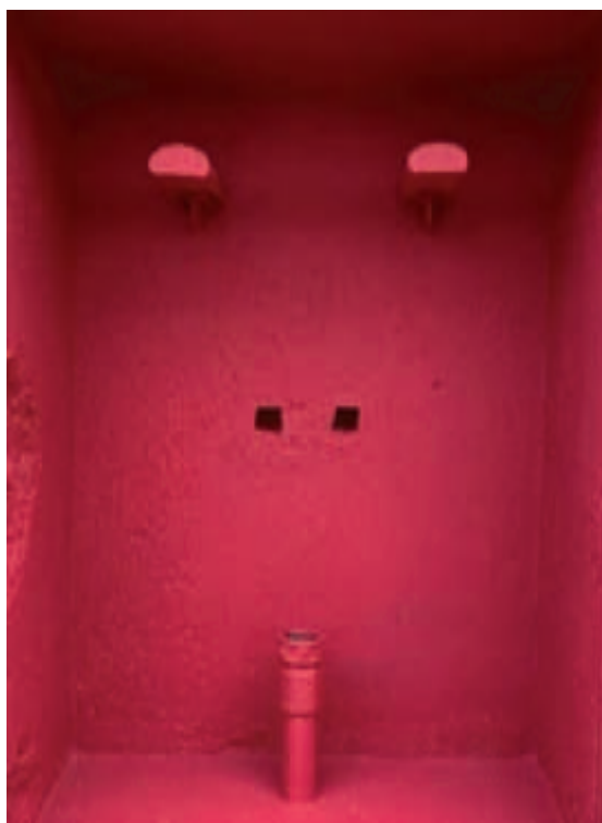
Fig. 3 – a expressão antropomórfica na Quinta do Almargem, Outubro de 2022

Ora, indo mais para a frente, hoje tomaremos com valor a expressão Gosto Disto , procurando ilustrá-la numa atmosfera indefinida para que possa acolher novas figurações. Uma outra, nova figura (fig. 3) cumpre o investimento e a revelação das duas primeiras (fig. 1 e fig. 2), investindo na convicção que na Natureza das coisas se expressa Beleza. 1 O amor é desejo de Beleza, ou desiderio de Bellezza , como, diz Trias citando Marcilio Ficino.