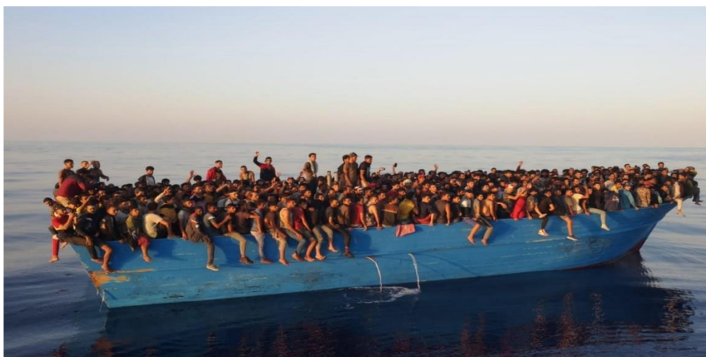
Fig. 3 – Itália (Embarcação com migrantes circulam sobrelotadas no Mediterrâneo)

Um caso anterior foi determinante para compreendermos esta situação dos migrantes forçados, em Itália. Queixa de três cidadãos tunisinos chegados à Itália em 2011 e expulsos a seguir em condições difíceis. Acórdão da Seção do TEDH, identificando violações de modo coerente. Acórdão da Grande Chambre proferido a seguir, de muito difícil leitura.