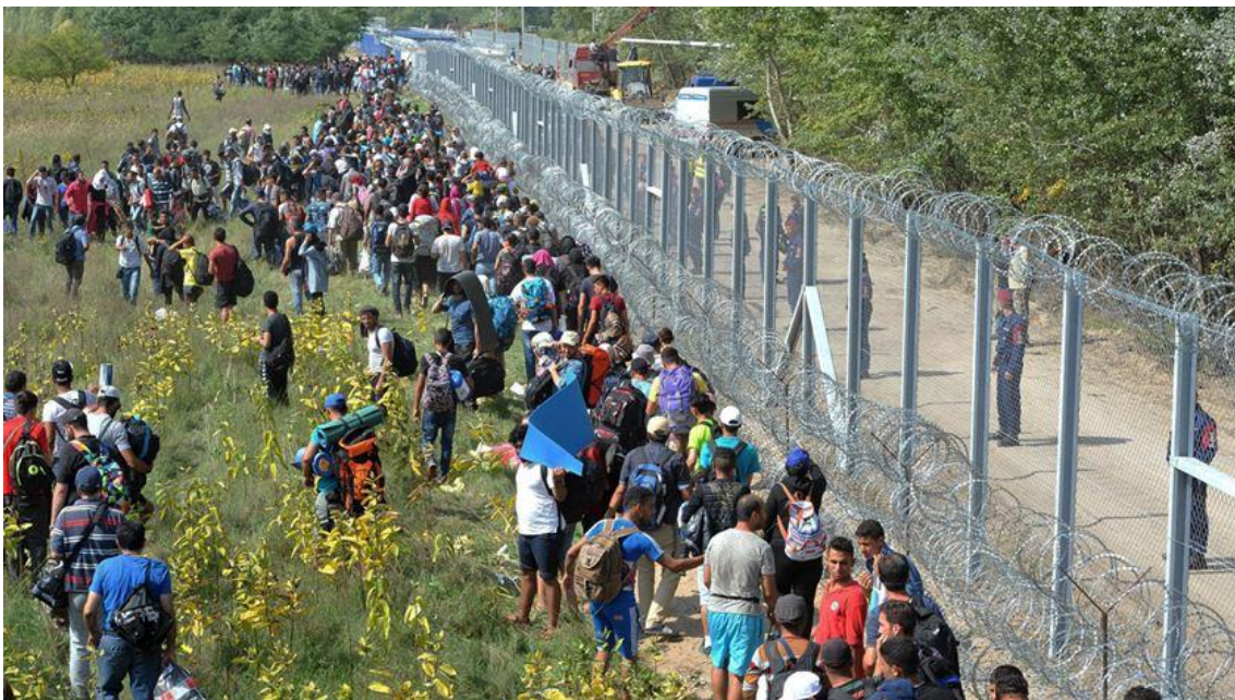
Fig. 2 – Hungria (migrantes forçados impedidos de entrar na fronteira do país)

decisiva na escolha dos migrantes forçados que deveriam permanecer ou abandonar o seu território, pelo que Orbán o via como uma medida ilegítima, considerando que os líderes europeus não possuíam autoridade para executar resoluções acerca das recentes migrações que previssem a sua aplicação num Estado, quando essa não era a vontade do mesmo (Orbán, 2015). À luz deste raciocínio, Szabolcs Takács, Secretário de Estado húngaro dos Assuntos Europeus, ressaltou também a desvinculação do país ao referido compromisso: “We will not accept any kind of compromise that includes the mandatory distribution of immigrants and asylum-seekers [...] Hungary has no legal or political obligation to become a country of immigrants” (Takács, 2018). Viktor Orbán acrescentou ainda que o sistema de quotas não seria um bom método para solucionar a crise, uma vez que em vez de manter os fluxos migratórios longe, funcionava como um convite para que viessem para o território europeu, o que propagava o terrorismo e fomentava a recriação de fronteiras internas dentro da UE como forma de os Estados providenciarem a sua própria segurança (Orbán, 2015a). Neste contexto, o modo de atuação húngaro face às migrações regia-se pelo princípio de “export help, not import problems” (Orbán, 2018), concebendo que a única solução viável era travar a vinda dos fluxos migratórios para a Europa e não arranjar uma forma eficaz de os gerir já dentro da EU. (Botelho, 2020, p. 38)