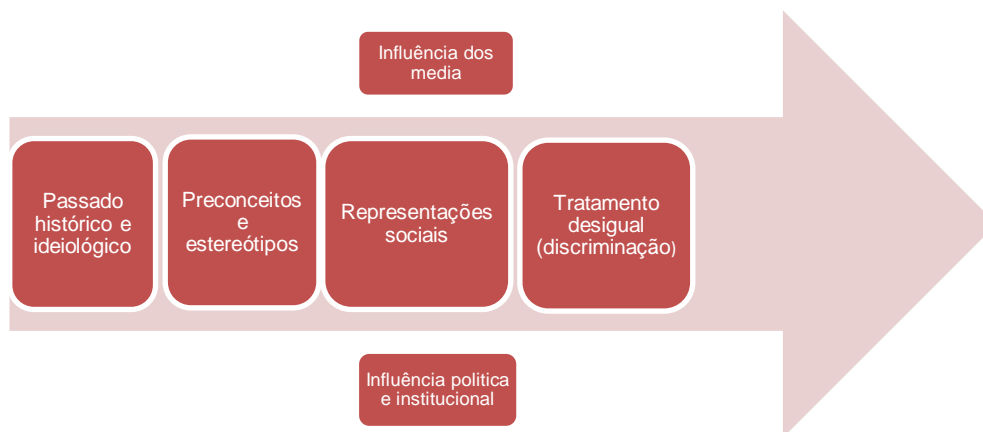
Ilustração 1 - Processo discriminatório. (Ilustração nossa, 2022).

negros). Conduzindo ao reconhecimento de uma identidade sobre os países ocidentais como manifestamente opostos e contraditórios ao resto do mundo, encontrando um discurso eurocêntrico justificativo das colonizações e da superioridade branca (Ocidente democrático cristão) face às restantes (Araújo e Maeso, 2010). Deste modo e refletindo todo o procedimento analisado e envolvente para a compreensão da fonte de discriminação no seio de uma sociedade, formulo a seguinte ilustração para uma interiorização visual e simplificada do que se tem vindo a ser abordado.