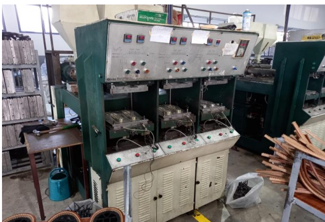
Figura 3- Máquina de injeção termoplástico (TR)

Ainda de acordo com o autor a validade externa é definida de acordo com a possibilidade de através das descobertas de um determinado estudo de caso se obterem generalizações, estudos de caso múltiplos como é o caso do nosso estudo oferecem uma base de generalização rica e mais robusta na medida em que a generalização é replicada.