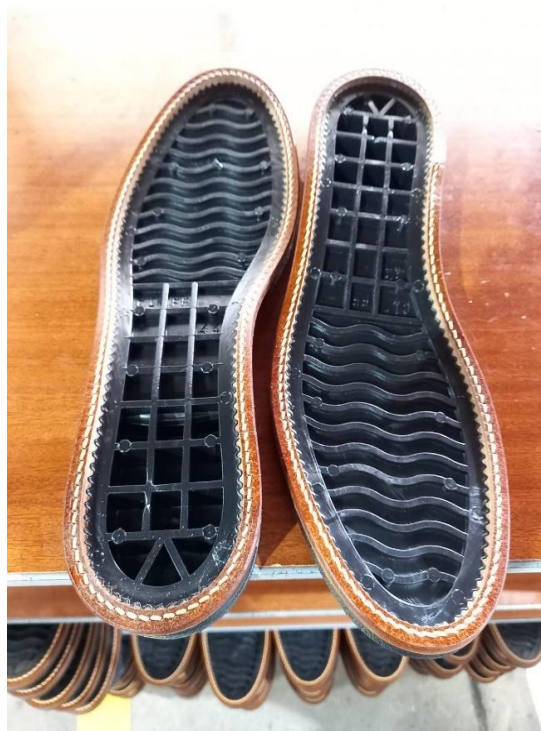
Figura 4- Par de solas, componente integrante do sapato.

Observou-se que há uma grande disparidade no que respeita às profissões dos inquiridos, sendo que a maioria desempenha a função de operária (o) de mesa (17,6%),