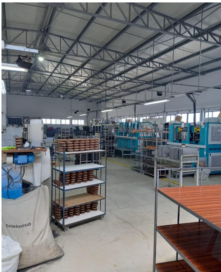
Figura 1- Unidade industrial de produção de solas para sapatos.

Segundo Jacobides e Reeves (2020) a pandemia do Covid-19 afetou gravemente o consumo, forçando as pessoas a largar velhos hábitos e adotar novos, é, portanto,