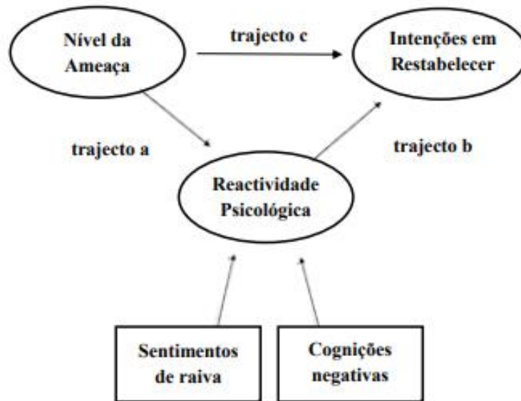
Figura 1 Modelo da Reatividade Psicológica

Adaptado de Roubroeks, M., Ham, J., & Midden, C. (2011). When Artificial Social Agents Try to Persuade People: The Role of Social Agency on the Occurrence of Psychological Reactance. International Journal of Social Robotics , 3, 155-165. Cit. in Félix, 2014