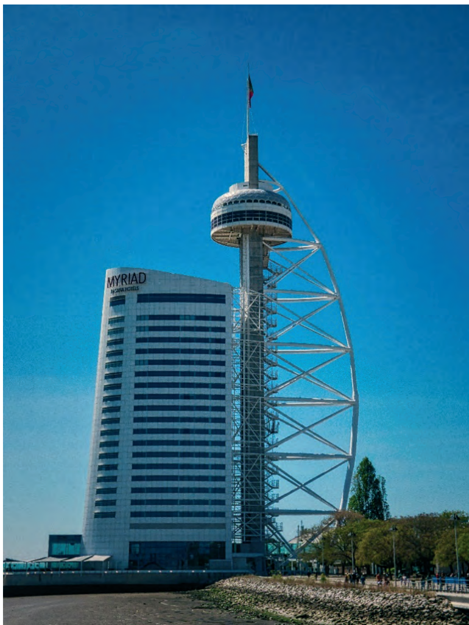
Ilustração 1 – Hotel Myriad, Torre Vaco da Gama, Portugal (Ilustração nossa. 2023)

A evolução dos tempos trouxe a banalização, com a despreocupação em fazer corretamente, colocando em risco a arquitetura. Na atualidade, assiste-se à construção por módulos, apenas uma junção de for-