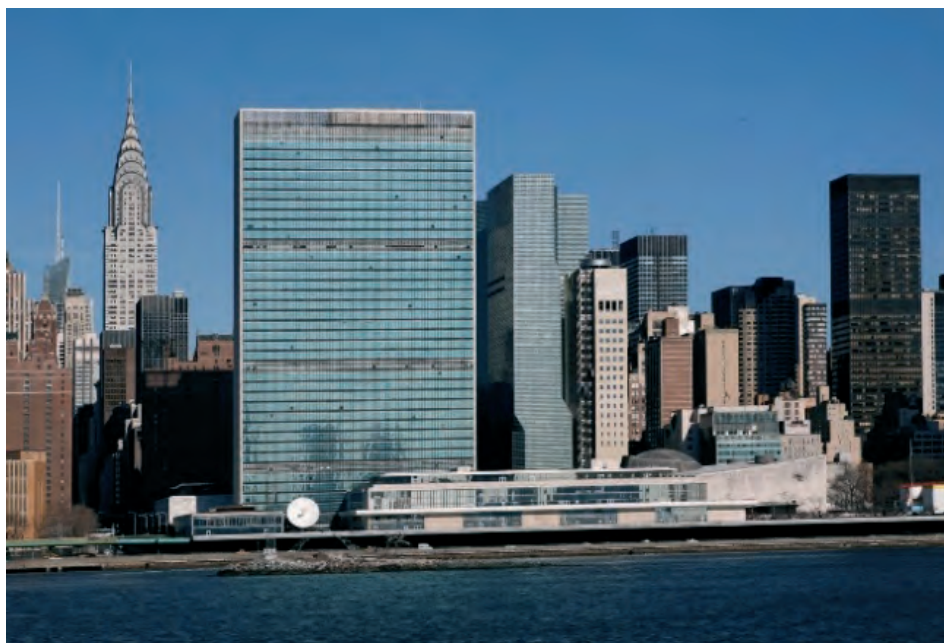
Ilustração 1 – Construção em altura associada ao poder e ao capitalismo Sede da Organização das Nações Unidas, em Nova Iorque

mem descobre as estruturas do mundo. A arte da luz assume-se como linguagem do homem, enquanto o silêncio da sombra é o significado de uma vida infinita. Portanto, a ordem do desenho arquitetônico é o resultado da sombra-luz em confronto com o silêncio. Le Corbusier fala da fragmentação do objeto, numa atitude de linhas e de vazio fazem parte de uma tendência e de uma filosofia para diversas interrogações da formalização do objeto, estão relacionadas com as novas teorias das ciências físicas, que se debruçam sobre a decomposição da matéria em partículas e espaço, e a interação entre a matéria e a luz.