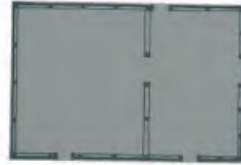
Figure 3 - Ancient house in Setil [18]