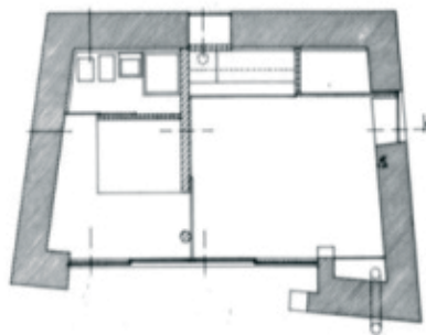
Figure2 - Gerês House [17]

A casa do Gerês (Vieira do Minho 1980-1982) é uma das primeiras obras de Souto de Moura. A casa situa-se no norte de Portugal. No meio