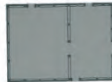
Figure 5 - Ancient house in Casa Branca [20]