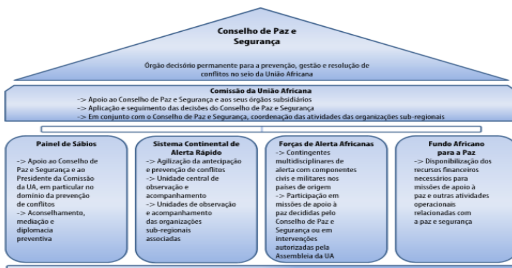
Ilustração 3 - Componentes da Arquitetura de Paz e Segurança Africana a nível da União Africana