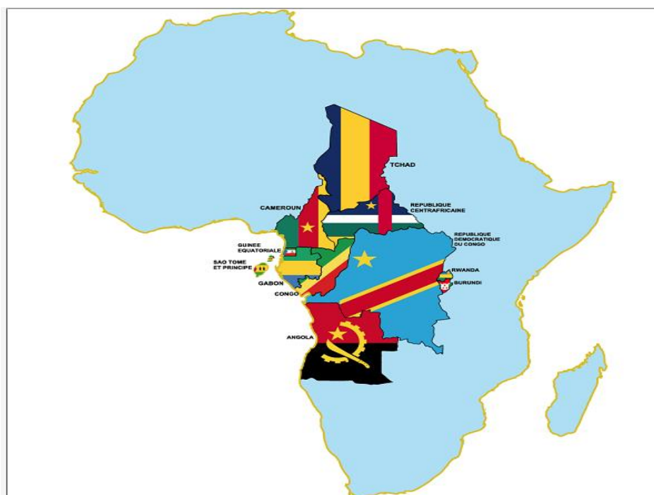
Ilustração 1 - Demarcação da África Central. (UNOCA, 2022).

O presente capítulo foi concebido com objetivo de procedermos ao enquadramento teórico do tema em estudo, tendo em atenção os conflitos da AC e a CEEAC.