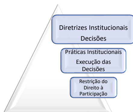
Ilustração 1 - Participação da Pessoa Residente em ERPI num Modelo de Funcionamento Centralizador e Unidirecional. ([Adaptado a partir de]: Barrios, 2017)

dos quotidianos da instituição, assimilando as regras e normas institucionais, restringindo as suas manifestações de opiniões, sugestões e decisões, que com o passar do tempo dá origem a estados de conformismo e de renúncia do direito à participação.