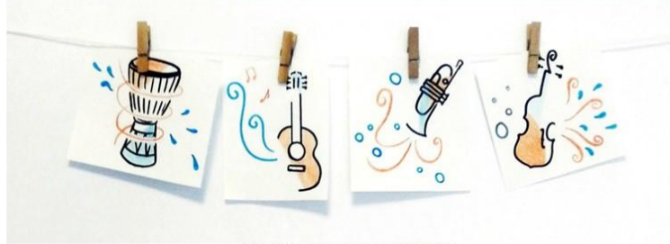
Catarina Lourenço de Carvalho Musicoterapeuta

Centro Lúdico de Massamá, 08 outubro 2020