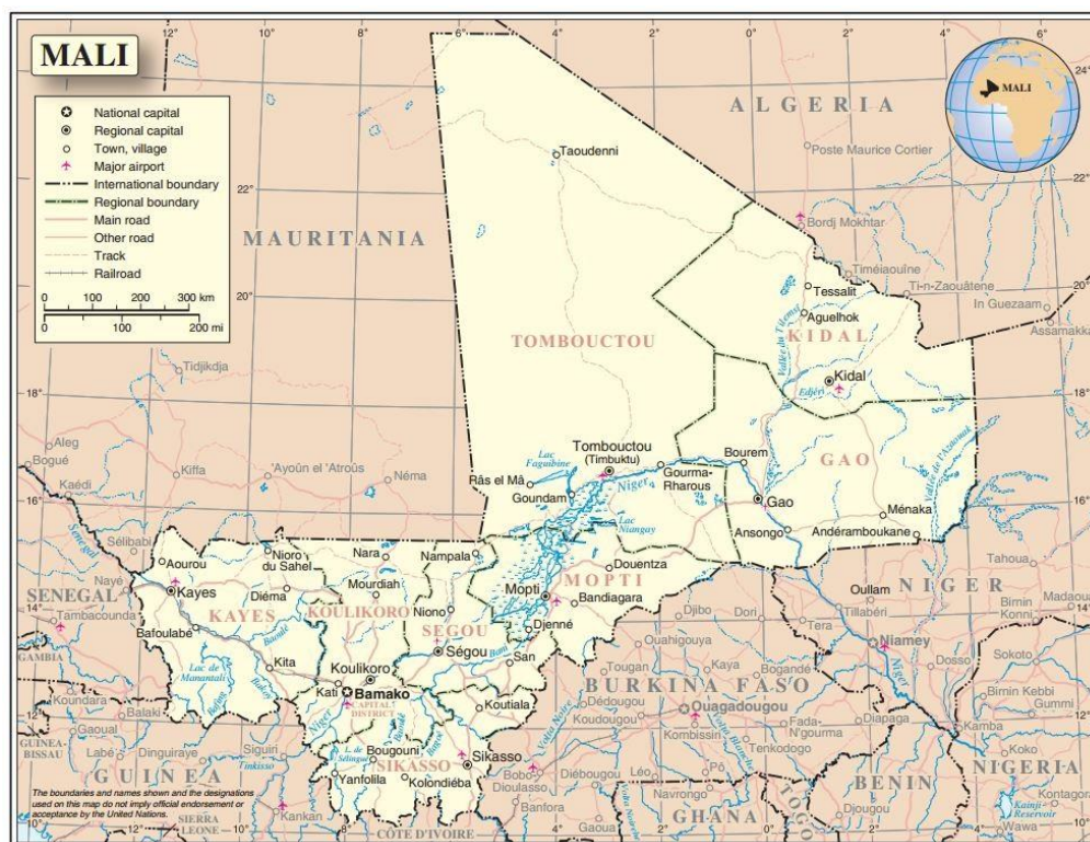
Ilustração 1 – Mapa do Mali, Organização das Nações Unidas – Departamento de Apoio no Terreno. ([Adaptado a partir de:] Secção cartográfica, 2013).

Situado no interior do ocidente africano, ladeado pelo conjunto de Estados que consigo formam a “fronteira” de areia que separa o Norte do continente e a África subsaariana e que compõem a região do Sahel, o Mali vive uma crise política e securitária desde há vários anos, impulsionada pelo golpe de Estado levado a cabo a 22 de março de 2012, que depôs o até então Presidente incumbente Amadou Toumani Touré (Sambe, 2012). A conjuntura interna político-securitária inerentemente debilitada, em função de múltiplas vulnerabilidades e de um legado histórico de conflitos, é exacerbada pela heterogeneidade cultural e étnica de grupos cujas pretensões independentistas, aliadas aos efeitos de contágio dos países vizinhos, deram origem ao seu mais recente e disruptivo período de conflito e crise político-securitária (Djiré et al. , 2017).