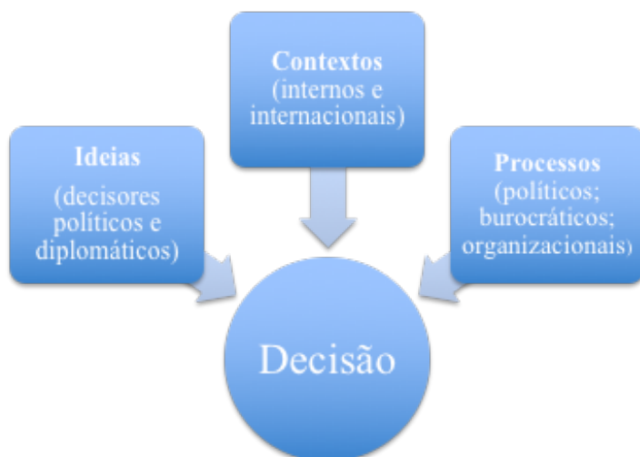
Imagem 1 - Visão subjetiva, contextual e processual da abordagem fenomenológica da APE