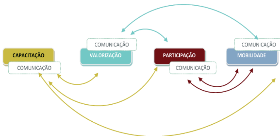
Figura 1 - Pilares de intervenção da mediação social e comunitária em CAD

Comunicação: “O primeiro pilar é a comunicação, entendida como um processo de partilha e de participação de uma mensagem, de forma a torná-la comum a todos os atores envolvidos. É, simultaneamente, um instrumento facilitador do estabelecimento da relação com o outro. No esquema de intervenção, ela é o elemento de ligação entre todos, estando na base de todos os processos, permitindo a regulação das relações.”