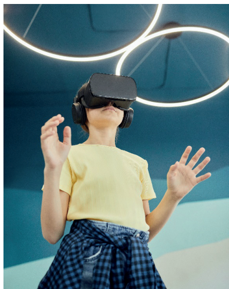
Ilustração 3. Realidade virtual

de interagir com o espaço, onde a riqueza e dinamismo de informação se apresenta como fator dominante.