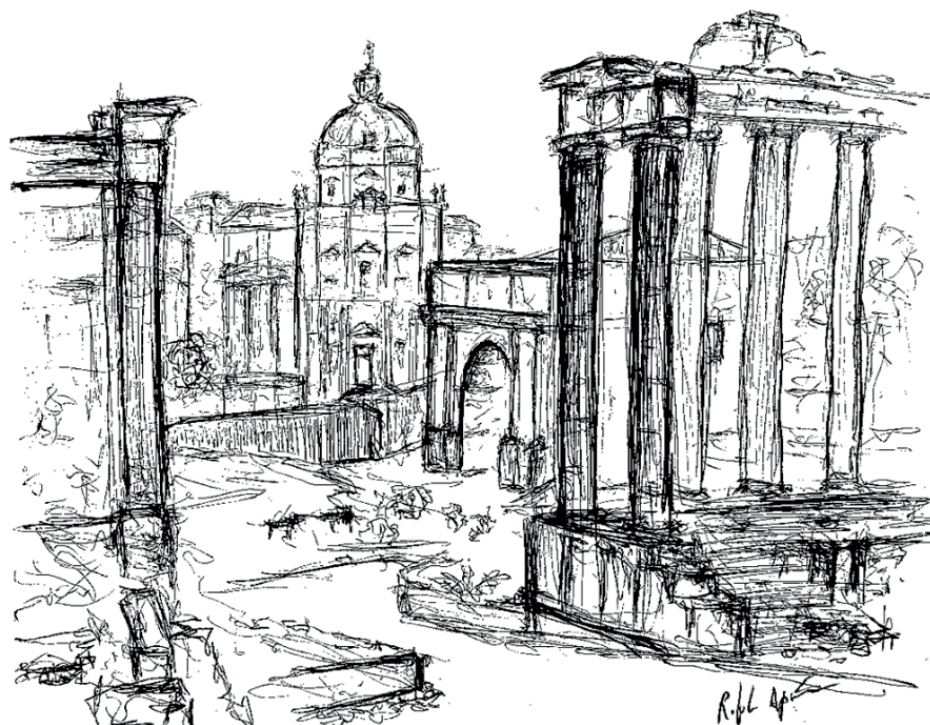
Figura 2 - Composição figurativa das ruínas Romanas

As pré-existências que renegam à efemeridade comportam um valor histórico, cultural e social e, tendo em conta a sua localização, assumem uma continuidade na medida em que perpetuam a sua identidade patrimonial, quer em espaço urbano quer em espaço rural. Esta tomada de consciência sobre a importância da análise directa das arquitecturas do passado corresponde ao início de atitudes e movimentos que visavam a preservação patrimonial, conscientes da necessidade de se conservarem as referidas obras, acentuou-se a problemática em torno da legitimidade de se intervir, ou não, nas edificações do passado e de que modo, essa intervenção iria pôr em causa a integridade das mesmas. A questão de intervir na ruína originou diversas posições, muitas vezes contraditórias: as que lhe ditavam um fim de ciclo, quando já não haveria hipótese alguma de a preservar, renunciando a qualquer tentativa de restauro indicando que a sua última hora inevitavelmente soará, mas que soe o mais aberta e francamente, e que nenhuma