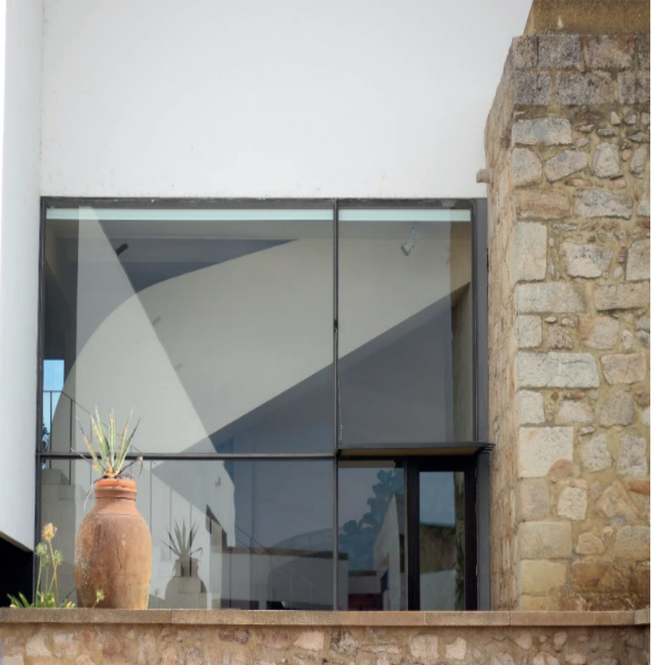
Figura 1 - Pormenor da pousada Flor da Rosa no Crato

Assumindo-se a temática da pré-existência como o testemunho da memória e da identidade, que nos permite comportar um sentimento de pertença a um determinado lugar, e conhecer nas diversas civilizações as diferentes tradições, ritos, crenças, experiências e manifestações culturais que tanto as evidenciam e ou caracterizam. Assim sendo, a condição de ruína assume-se como a matéria preponderante no entendimento e compreensão do passado, expondo algumas das suas memórias, no corpo da sua arquitectura. Este objecto de estudo pretende evocar uma atitude interventiva e sustentada nessas valorosas