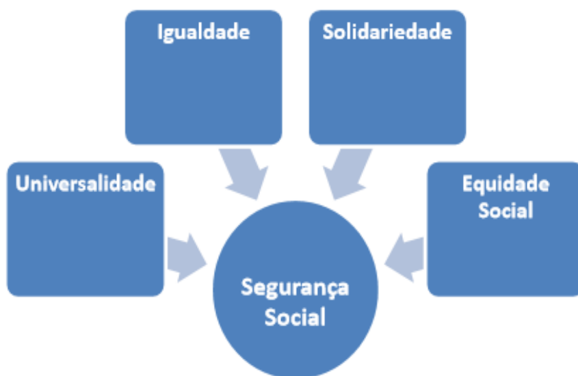
Ilustração 2 - Princípios da Segurança Social. (Ilustração nossa, 2021).

A Segurança Social é um sistema destinado a todos os indivíduos, guiado pelos princípios da universalidade, igualdade, solidariedade e equidade social (Lei de Bases da Seg. Social, Lei Nº 4; 2007).