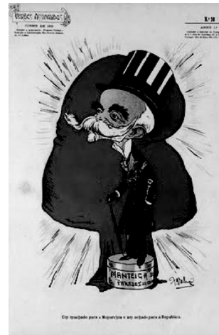
Fig. 2 - Caricatura de Bernardino Machado, o único presidente da República que exerceu a chefia do Estado em duas fases distintas (1915-1917 e 1925-1926).

Pertenciam a gerações muito diferentes: os dois primeiros, Arriaga e Teófilo, eram da mesma geração, sendo o seguinte, Bernardino Machado, um pouco mais novo. Canto e Castro, António José de Almeida e Gomes da Costa tinham nascido nos anos 60, assim como Carmona. Sidónio Pais era dos anos 70, sendo não só mais novo do que todos os demais chefes de Estado da primeira República, como também mais jovem do que dois dos seus sucessores da segunda República, Gomes da Costa e Carmona. Craveiro Lopes e Américo Tomás eram da mesma idade. De idêntica geração foram Spínola e Costa Gomes, assim como Ramalho Eanes, Jorge Sampaio e Cavaco Silva. A destoar, Mário Soares, mais velho do que o seu antecessor uma década e uma década e meia do que os seus dois sucessores.