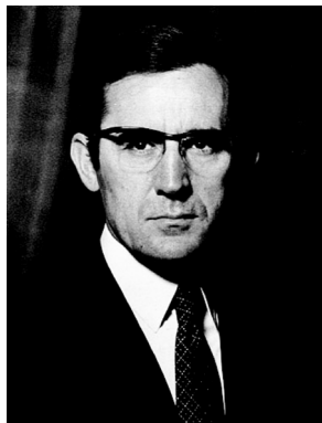
Fig. 5 - Ramalho Eanes, o primeiro presidente eleito por sufrágio universal e directo depois do 25 de Abril de 1974.

Américo Tomás, deportado para a ilha da Madeira, foi depois autorizado a ir viver para o Brasil, fixando-se no Rio de Janeiro. Regressou a Portugal em 1980 e morreu sete anos depois, na maior discrição, nunca tendo visto satisfeito o seu desejo de ser reintegrado na marinha.