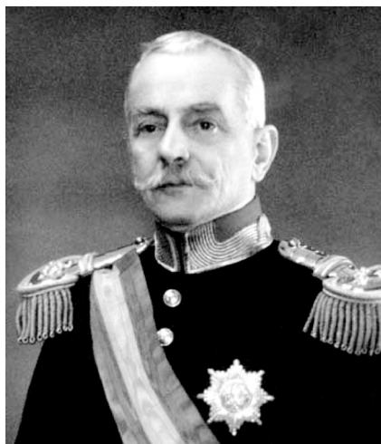
Fig. 4 - Óscar Carmona, a pessoa que mais tempo desempenhou as funções de presidente da República (1928-1951).

Na terceira República, as eleições (1976, 1981, 1986, 1991, 1996, 2001 e 2006) têm sido todas feitas segundo o prescrito na Constituição de 1976, actualmente em vigor.