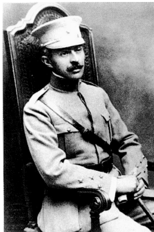
Fig. 3 - Sidónio Pais, o primeiro presidente da República eleito por sufrágio universal e o único a ter morrido assassinado (1918).