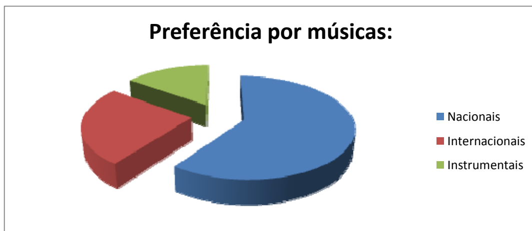
Ilustração 1 – Preferências Musicais

Questionário de preferência musical. Durante a fase de avaliação, realizou-se, como referido anteriormente, um questionário sobre as preferências musicais utentes do Lar “Nossa Senhora da Paz”. Os dados encontram-se sistematizados na seguinte ilustração: