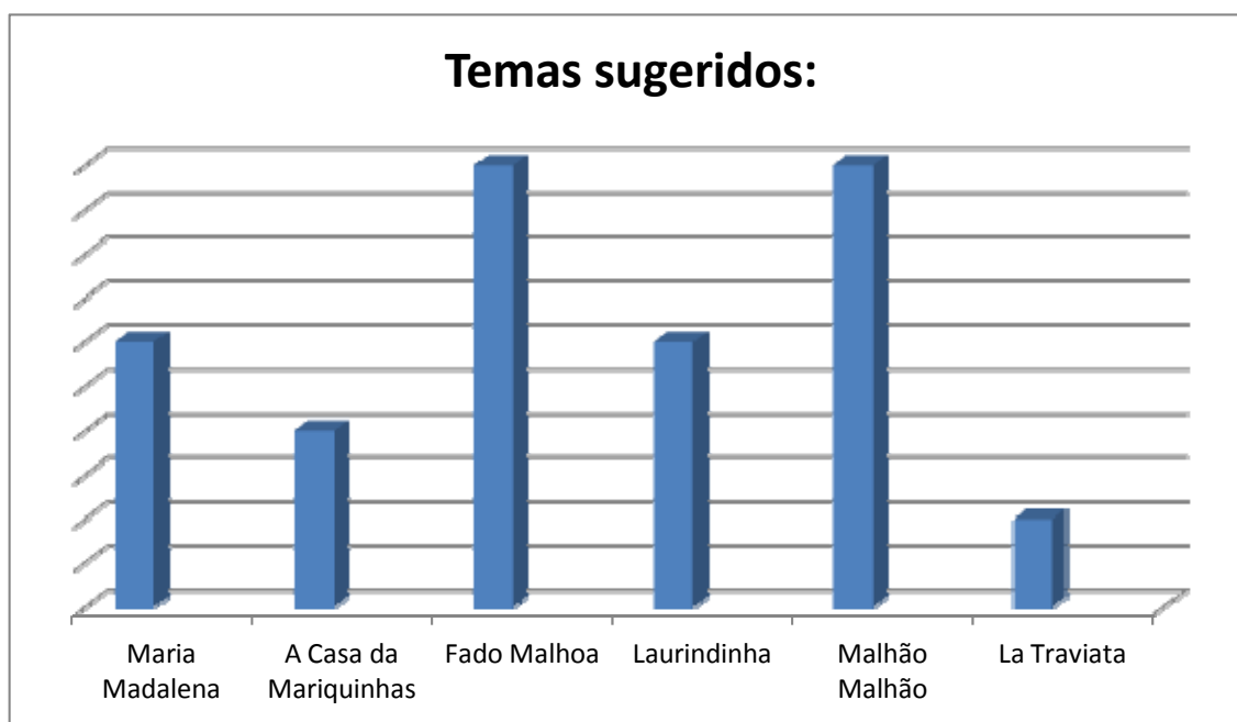
Ilustração 4 – Temas Musicais Preferidos

Na Ilustração 4, representa-se os temas preferidos dos utentes do Lar. Na sua maioria, eles preferiam temas ligados ao fado e à música tradicional, sendo os temas de eleição o “Fado Malhoa” (da Amália) e o “Malhão Malhão” (género tradicional).