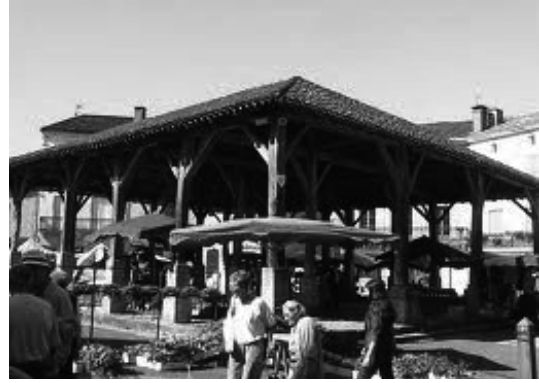
Belvès. França 2008. Mercado do séc. XVI utilizado como feira de degustação de produtos gastronómicos

melha (ícone de tal forma valorizado que, por vezes, é identificado com a própria festa, como a cerimónia de entrega dos Óscares em Hollywood ou carregado de significado simbólico como aconteceu no incidente ocorrido em Coimbra nos anos 60 quando os estudantes retiraram do chão as capas à passagem do Presidente do Conselho de Ministros em manifesto sinal de protesto).