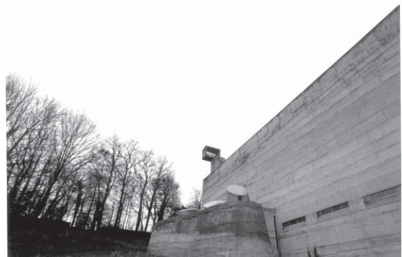
CINZENTO - Couvent de La Tourette, 2001 L'Arbresle, França.

É um lugar onde o desenho da arquitectura, por mais eloquente que seja, nos parece pouco, e onde o seu discurso só se deveria construir com mudez, em gestos de silêncio, desde o verdadeiro sentido ou razão das coisas, do que já lá está. A retórica pareceria sempre frugal, demasiado frágil ou falsa.