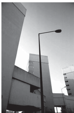
"Cinco dedos", Lisboa 1998. Projecto de Vitor Figueiredo, 1971, em Chelas.