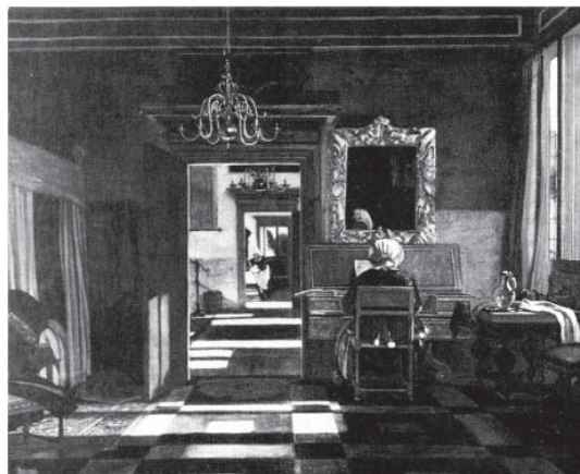
MAGENTA Emanuel de Witte, "interior com uma mulher que toca" 1660 Catálogo de Museum Boymans-van Beuningen , Rotterdam