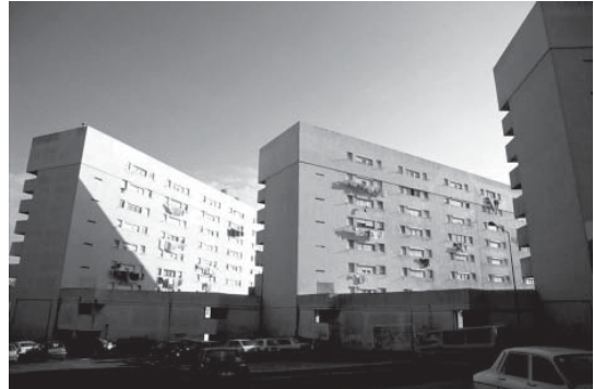
Projecto de Vítor Figueiredo, 1971, em Chelas.

menos a ideia de espaço e de absoluta reclusão. Fica a falta do mundo e o negro.