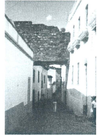
A arquitectura intercomunica corpos situados no mesmo lugar

...o ser, o lugar, a geração são três princípios distintos e anteriores à formação do mundo.