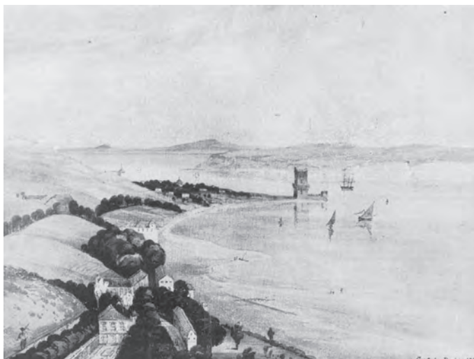
Figura 3 – A encosta de Algés e o extenso areal que vai de Ribamar a Belém, onde está a Torre de Belém, em 1851. Para além da Torre de Belém estão as elevações que formam a margem esquerda do rio Tejo.

Quando Captain Parke registou a Torre de Belém, em 1851 (Figura 3), já há muito se havia instalado em Pedrouços, nas suas quintas e palácios campestres, a nobreza de Lisboa que, quando surgiram os banhos de mar, desceu ao rio e tomou banhos na sua praia 11 . Neste registo iconográfico observamos, em primeiro plano, o areal de S. José Ribamar até Belém, estando representados: o convento de S. José de Ribamar, o palácio de Nossa Senhora da Conceição e o palácio mandado construir pelo conde de Vimioso - junto ao local onde Polycarpo Pecquet Ferreira dos Anjos veio a construir o Chalet Miramar.