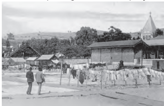
Figura 6 – A estação de caminho de ferro de Algés, contígua à praia e situada em frente ao Chalet Miramar rodeado da sua romântica vegetação, no verão de 1910.

A primitiva estação de Algés situava-se mesmo defronte do Chalet de Miramar 29 , no Largo da Estação, estando contígua à praia (Figuras 6 e 7). A companhia concessionária deste ramal de caminho de ferro, divulgou pela primeira vez, em Agosto de 1891, no seu órgão de informação próprio ( Gazeta dos Caminhos de Ferro ), a venda de maços de bilhetes por zonas e com preços reduzidos, válidos para ida e volta, com a condição de serem utilizados na primeira vigem matutina a partir de cada um dos extremos da via férrea 30 . Esta inovação deverá ter-se tornado popular entre aqueles que não dispunham de recursos para uma temporada de veraneio deslocados da sua habitação permanente, pois permitia ir e voltar em pouco tempo a preços acessíveis. Em 1894 a Companhia de Caminhos de Ferro deu um novo impulso à captação de passageiros com destino a Algés, com a criação de bilhetes de banhos de mar para grupos de cinco ou mais passageiros, ainda a preços mais reduzidos 31 .