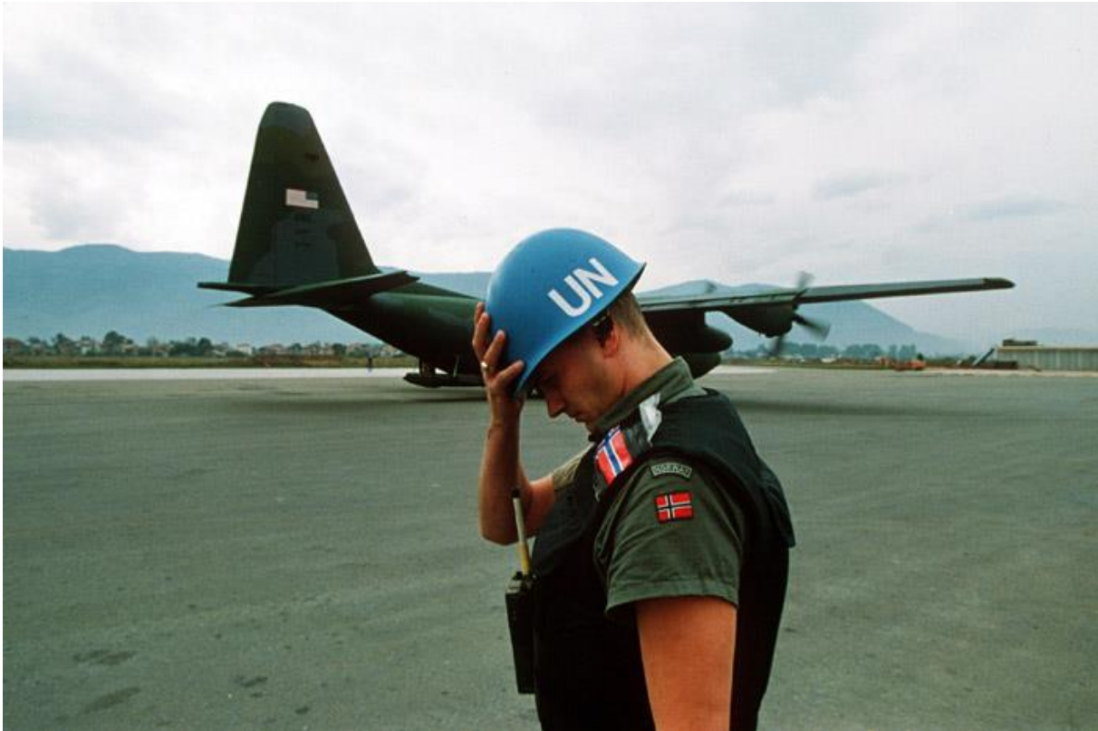
Figura 4 - Mikhail Evstafiev. (1992). A United Nations peacekeeper from Norway holds his helmet as a Hercules C-130 transport plane lands at Sarajevo airport in the summer of 1992.

num terceiro momento, foram monitorizados os acordos de cessar-fogo e realizados os procedimentos habituais num contexto pós-guerra, nomeadamente o trabalho de reconstrução do status jurídico e institucional dos estados afetados pelos conflitos, com o objetivo de consolidar a paz, bem como suportar e auxiliar a nova ordem institucional e financeira (Nascimento, 2007).