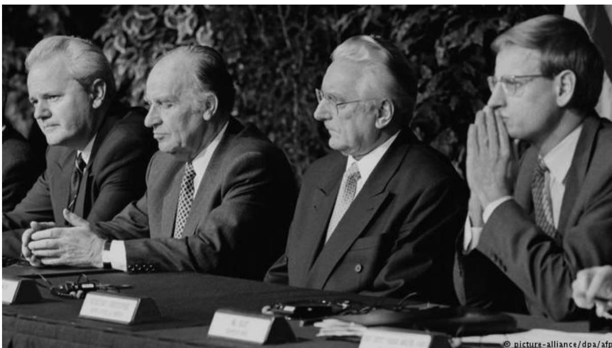
Figura 3 - (1995). Os presidentes Milošević, da Sérvia, Izetbegović, da Bósnia-Herzegovina, Tuđman, da Croácia, e o negociador da UE, em Dayton.

Por conseguinte, o acordo de Dayton acaba por reconhecer as nacionalidades bósnia, croata e sérvia, bem como os seus respetivos idiomas, sendo, portanto, reconhecida a diversidade étnica e cultural presente no território. As restantes minorias nacionais, ou os filhos de casamentos mistos, não são considerados como sendo membros de um grupo em específico, no entanto, os direitos sociais, culturais e políticos acabam por depender diretamente da inclusão do indivíduo numa das duas entidades estabelecidas pelo acordo em questão, motivo pelo qual, e para se ser cidadão da Bósnia-Herzegovina, é indispensável que o indivíduo possua uma nacionalidade específica e habite numa das duas entidades referidas (Peres, 2013).