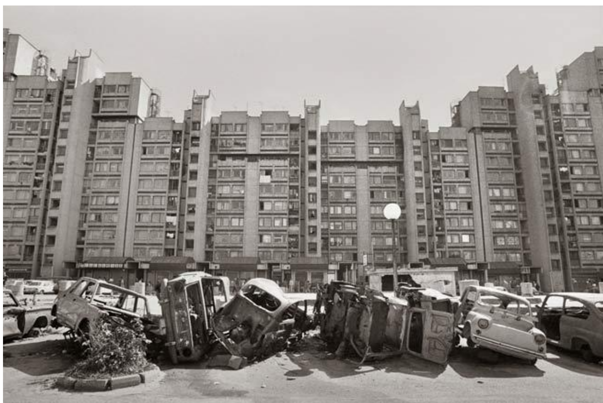
Figura 2 - Gervasio Sánchez. (1993). Coches aparcados en batería . Sarajevo.

Com efeito, a guerra da Bósnia-Herzegovina caracterizou-se pelos confrontos diretos e extremamente violentos entre as diversas etnias. Os membros pertencentes à etnia sérvia, apoiados pelo Exército Nacional Jugoslavo, combatiam as forças bósnias e croatas que, por sua vez, combatiam igualmente entre si, sem existir distinção entre militares e civis. Durante este período negro importa destacar o cerco de Sarajevo. De facto, a capital da Bósnia-Herzegovina encontrou-se cercada desde o dia 5 de Abril de 1992 a 29 de Fevereiro de 1996, sendo considerado o maior cerco a uma capital, na história militar contemporânea. Bombardeamentos constantes e escassez de recursos vitais, tais como água e comida, fizeram, efetivamente, parte do dia-a-dia da população durante todo o cerco (Mello Valença, 2006).