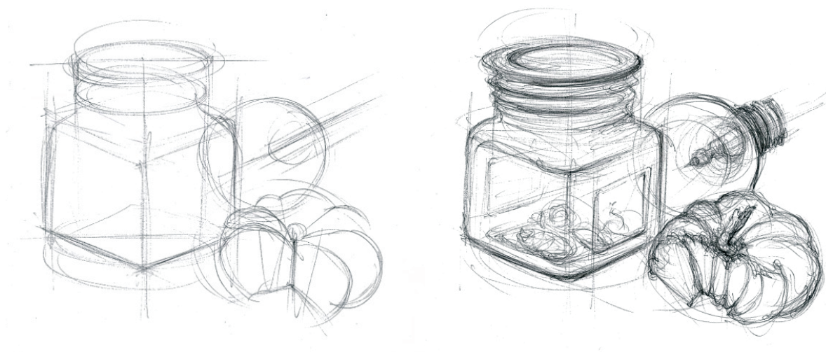
Figuras 2 e 3 - desenho de aluno

Todas as características que observámos, baseadas no controle das variáveis que elencámos (e de outras que não chegámos a elencar) podem ser engenhosa e sabiamente integradas em procedimentos metódicos, com fins pedagógicos. Disso trata a nossa disciplina, disso apresentaremos aqui uma breve ilustração.