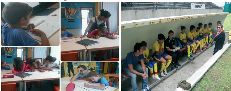
Ilustração 2 – Imagens da atividade 'Escolinha social de futebol de rua'

No decorrer do projeto participaram 192 crianças e jovens na 'Escolinha Social de Futebol de Rua'. Aliando os resultados escolares das crianças com a titularidade nos jogos e intercâmbios sociodesportivos e nos torneios comunitários, foi possível verificar uma evolução e mudança positiva dos participantes e da comunidade em geral, comprovada pela redução das situações de exposição a comportamentos de risco, abandono, absentismo e insucesso escolar, tal como a melhoria das competências pessoais e sociais. O sucesso educativo dos participantes aumentou quer a nível dos resultados, quer na