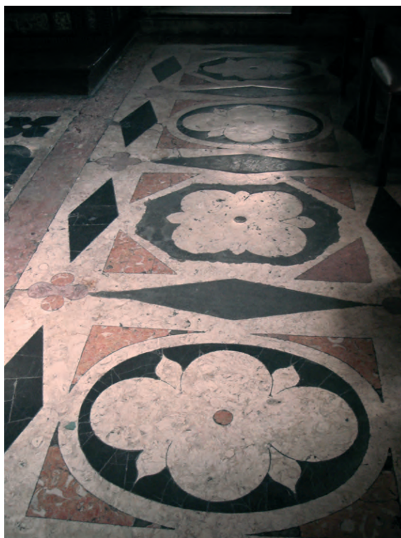
Foto 10 - Chão policromo de mármore

Do lado direito acha-se a entrada para a sacristia de planta quadrangular, com pavimento de embutidos de mármore policromo, tecto de madeira plano.