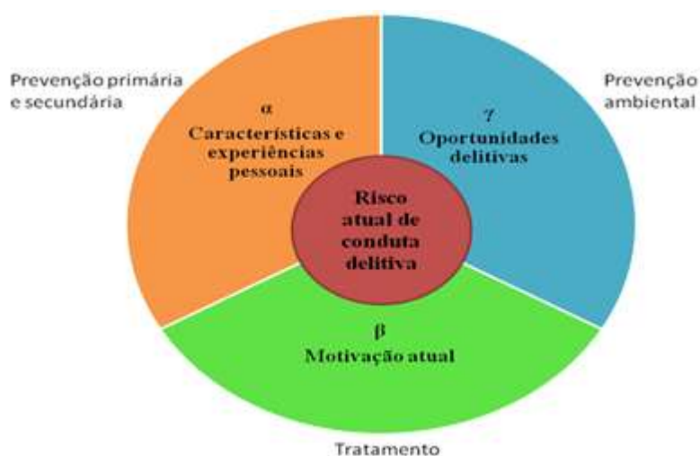
Figura I - Os grandes fatores de risco da conduta delitiva (Illescas, 2014)

Illescas (2014) refere que o risco atual (em um dado momento) de comportamento delitivo de um sujeito depende de três grandes categorias de fatores: ( \alpha ) características pessoais; ( \beta ) motivação atual; e ( \gamma ) fatores de oportunidade (cf. Figura I).