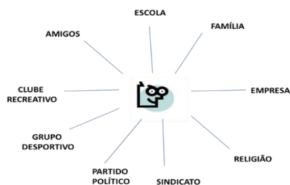
Gráfico 2 - Processo Socialização 27

Para Durkheim, o facto social, caracterizado pela sua exterioridade em relação ao indivíduo, consiste em “[...] toda a maneira de fazer, fixada ou não, suscetível de exercer sobre o indivíduo uma coerção exterior; ou ainda, toda a maneira de fazer que é geral na